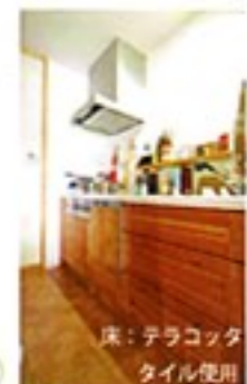
床：テラコッタ タイル使用